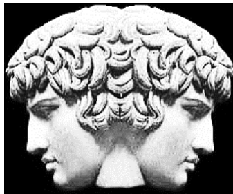
Diagram 8: Het Janus gezicht: tegelijkertijd naar boven en beneden kijkend (naar hogere en lagere holons), en naar buiten en binnen kijkend (tegelijk rede en technieken voor bewustzijnsontwikkeling gebruikend)

Met betrekking tot milieuvervuiling en klimaatverandering bijvoorbeeld kunnen mensen op een gegeven moment besluiten dat collectieve actie niet langer achterwege kan blijven daar anders hun fysieke voortbestaan op het spel komt te staan. In dat geval is samenwerking het gevolg van het kiezen van de minste van twee kwaden. Dat is een re-actieve bereidheid om te handelen. Het is rationeel maar onvrij gedrag. Het is gedrag dat gebaseerd is op - door onderhandelingen tot stand gekomen - overeenstemming tussen talrijke actoren: het Nederlandse poldermodel. Dit poldermodel zou aangevuld moeten worden met een pro-actieve bereidheid om te handelen, met vrij gedrag (zie de onderste route in Diagram 4). Technieken voor bewustzijnsontwikkeling bevorderen pro-actief gedrag. Koestler's zelf-assertieve en zelf-transcenderende tendensen komen overeen met het simultane streven van individuen naar autonomie of integriteit én integratie in grotere gehelen. Individuele integriteit en sociale integratie zijn beide nodig. De rede alleen kan dit niet bewerkstelligen. Zoals Schumacher opmerkt vormt het integreren van ogenschijnlijk tegengestelde tendensen the fabric of life . Het vereist een transcenderen van zulke tendensen op een hoger niveau van bewustzijn. De en/en situatie kan alleen maar 'geleefd' worden (zie ook Van Eijk 2015, Eenvoudig leven in een complexe wereld oftewel de paradox van eenheid-in-verscheidenheid . Civis Mundi).